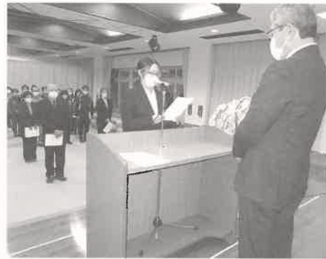
職員代表による宣誓

辞令交付式の終了後、全職員会議を行い、新年度の取組み、そして目標を改めて確認しました。やすらぎ会職員一同新たに気を引き締めて新年度に臨みたいと思います。