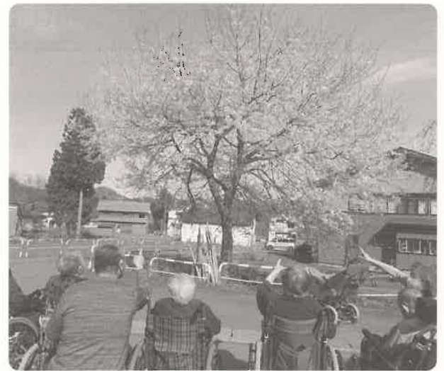
青空も桜もキレイだね

4月、外はもうすっかり春の陽気です。こんな日は外に出るっきゃない!というところで施設の周りの春を探しにみんなで散策に出ました。真っ白だった景色が今ではもう草木が茂り、春の訪れを感じます。暖かな日差しに包まれてみなさんも「きもちい」と思わず笑顔になります。いつも窓越しで見ているばかりも