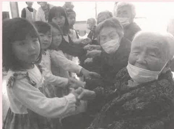
受けとってくれてありがとう