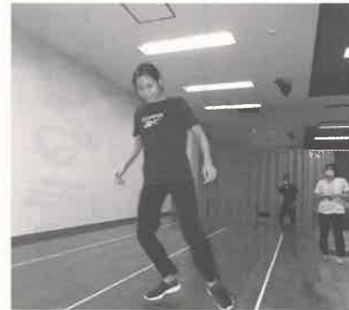
軽やかなステップ（反復横跳び）

職員の体力測定を行うのは初めての経験でしたが、同じ職場で働く仲間との健康管理に携わる事ができてやりがいを感しました。実際に行ってみると、すでに関節痛や高血圧の症状を患っている人や測定値が平均より劣っている人がいました。介護職は身体的に負担となる業務が少なくありません。利用者はもちろん、自分の身体を守るためにも今回の体力測定が少しでも健康意識の向上・生活習慣の改善に繋がれば良いと思います。