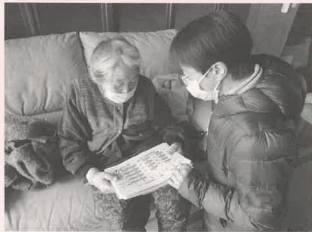
ご自宅に伺って相談援助

西和賀介護相談室では3名の介護支援専門員（ケアマネージャー）が常駐しております。この日は利用者さんの顔を見ての状況確認と現在のサービスにご満足いただけているか、またご家族にもお会いし、在宅での介護で何か困りごとはないかお伺いさせていただきました。利用者さんからは「デイサービスに行かせてもらって、たいしたい」と、生き生きとした表情でお話されておりました。ケアマネージャーは介護が必要な方と介護サービスを繋げる中心的な役割を担っています。今日も相談室の3名は、その相談窓口として奔走しています。