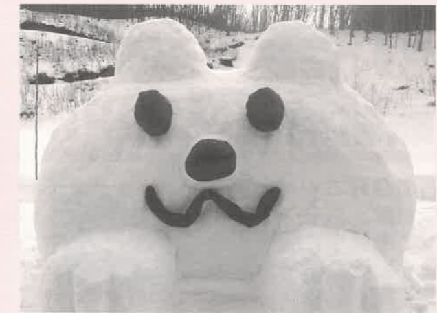
キュートなクマさん

かたくりの園では、西和賀町の真冬の風物詩と言われている「雪あかりinにしわが」に参加しました。今年は雪が少ないため少しずつ除雪をし、その雪を集めながらなんとか雪あかりを作成することができました。当日は雪が降り始め灯りが消えるなどのハプニングもありましたが、雪あかりに点灯すると幻想的な雰囲気になりました。利用者の皆さんにも楽しんでいただきたく、中庭には5m位の熊の雪像を作りました。利用者の方から「雪よく積み上げたごだよ」、「何つぐったごだよ」などの声をいただきました。