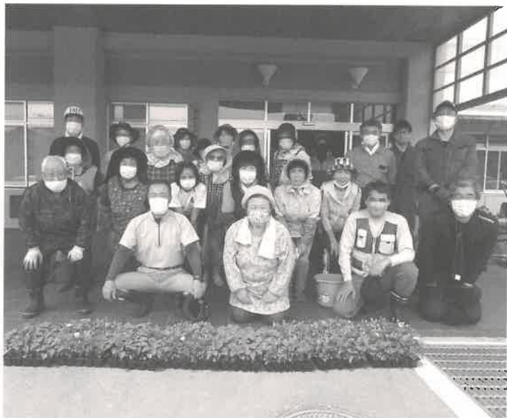
ご協力くださった家族会の皆さん

6月6日、多くのご家族の皆さんがぶなの園にお越しください、まずは施設前の道路や駐車スペースの草取り。伸び放題の状態だったため大変でしたが、丁寧な作業により見る見る草がなくなり、これだけで施設全体がだいぶ明るい