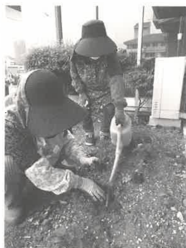
花植えはやさしく丁寧に

昨年の6月、家族会による環境整備活動を実施できるか直前まで悩み、感染予防対策を講じながらの実施となりました。今年も同じような状況で開催の可否を検討しましたが、この活動は入所者ご家族との心のふれあいも大きな目的であることから、予定通り実施されることになりました。