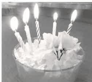
特製ケーキでお祝い

お祝いの特製ケーキや利用者の方々のプリンに職員がデコレーションし、ハッピーバースデーの歌で会がスタートしました。ケーキのロウソクに火をつけて合図をすると、ふうーとひと息で消してしまったキツさん。見た目だけでなく体力も年齢をまったく感じさせません。記念の色紙や写真をプレゼントした後で長生きの秘訣を伺ったところ「皆様にお世話になっていておかげです」と笑顔で答えてくださいました。その謙虚さがきつと秘訣なのでしょう。利用者の方々の皆さんで盛大に乾杯