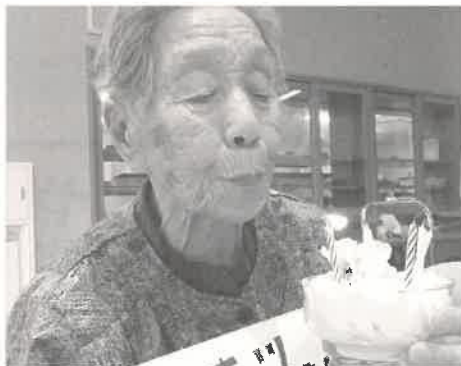
見事に吹き消してしまいました