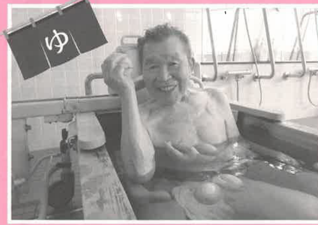
爽やかなレモンの香りが気持ちイー