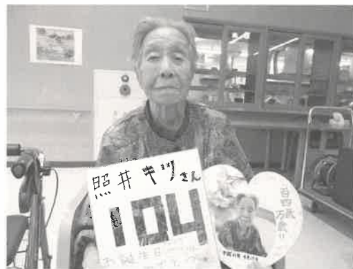
年齢を感じさせない若々しさです

し、おいしいケーキやプリンを味わいました。大正、昭和、平成の時代を生きて来られたキツさんには、これから歴史を刻む令和の時代も元気な時代を過ごしていただきます。