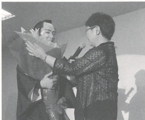
施設長より感謝の花束

と感動が交互に押し寄せてくる最高のステージでした。狭い会場で熱気がこもり、出演者だけでなく会場の皆さんも汗をぬぐいながらの約2時間でしたが、美しい役者の息づかいまで間近で感じる事ができたぶなの園公演となりました。