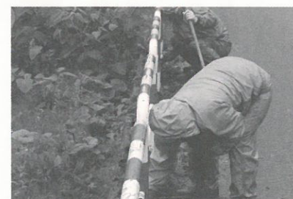
雨の中丁寧に作業するご家族

ぶなの園家族会の皆様には、施設で生活しているご家族が笑顔で暮らすことができるよう、様々なご支援をいただいております。その一つである「環境整備活動」が6月11日に行なわれました。プランターに色鮮やかな花の苗を植え込んで設置する作業、施設周辺に生い茂った雑草の刈り払いや草取り作業などです。この日は大雨の天候で風も強く、大変条件の悪い中での作業となりましたが、お忙しい時期にも関わらず多く