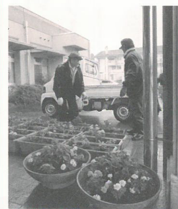
プランターに色とりどりの花

ぶなの園家族会の皆様には、施設で生活しているご家族が笑顔で暮らすことができるよう、様々なご支援をいただいております。その一つである「環境整備活動」が6月11日に行なわれました。プランターに色鮮やかな花の苗を植え込んで設置する作業、施設周辺に生い茂った雑草の刈り払いや草取り作業などです。この日は大雨の天候で風も強く、大変条件の悪い中での作業となりましたが、お忙しい時期にも関わらず多く