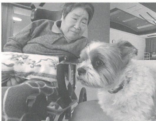
かわいくていつまでも見ていたい

4月26日、職員が自宅で飼っているワンちゃんをぶなの園に招待し、利用者の皆さんとふれあっていたきました。かわいいワンちゃんを見ればきつと喜んでくれるというねらいは見事の中し、あちこち元気に走りまわるのを目で追いながら、頭をなでたり声をかけたり。その表情は小さな子どもを見かけた時と同じで、「あやー、めんこいごだよ」と目を細めておりました。そして、利用者の皆さんの笑顔を見ることができた私たち職員もハッピーな気持ちになった午後でした。