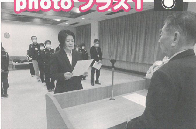
平成29年度も気を引き締めて ～辞令交付式で宣誓する職員～