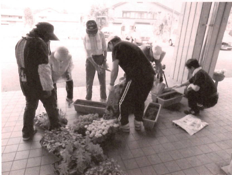
プランターへの植栽は色とバランスを考えて

で暮らしてほしいというご家族の思いが伝わってきます。作業終了後には、バーベキューで慰労を兼ねた懇親会。汗でカラカラになった喉を潤しながら家族同士、そして職員との交流が十分に図られたよう