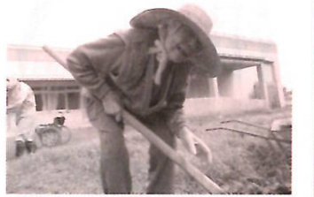
この土の感触がイイ!

ぶなの園中庭に、この夏ちっちな菜園が誕生しました。西和賀で長年暮らしてきた皆さんにとって、土の香りと感触はきっと心落ち着くはず。特養行事委員