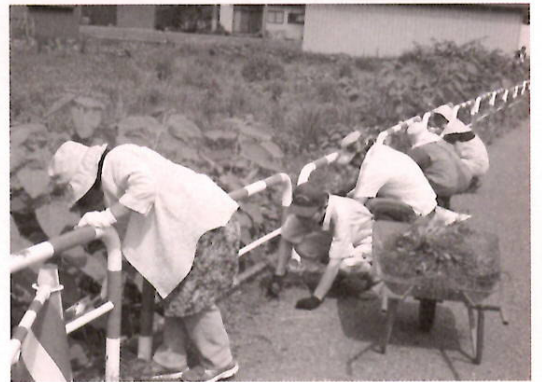
汗をぬぐいながらの草取り