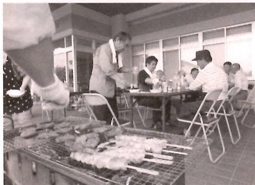
肉とビールで「お疲れ様でした」

です。こうした家族会の活動に私たちは支えられており、入所している皆さんも心強く感じていますことでしょうか。ありがとうございました！