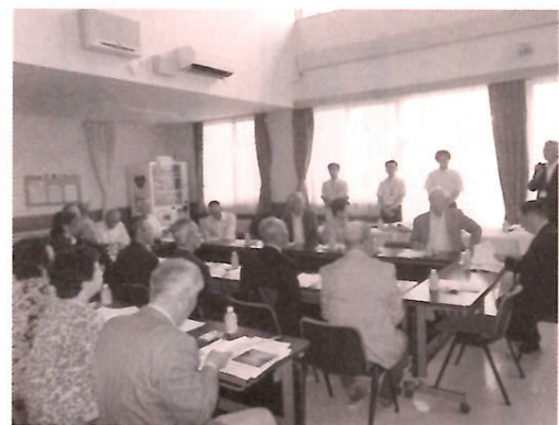
説明を拝聴する役員の皆さん

6月21日(火)法人役員21名で、宮古市の特養「サンホームみやこ」を訪問してまいりました。先駆的に取り組まれている地域貢献事業について学ばせていただくことを主な目的とした視察研修です。震災被災者を対象としたサロン活動はまさに住民に寄り添う公益活動であり、強く感銘を受けました。その他にも非常に参考になるお話しを伺うことができ、有意義な研修となりました。