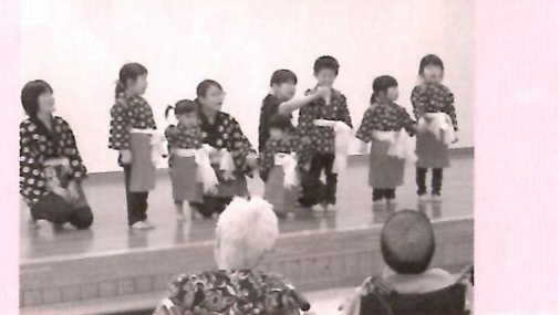
田植え踊り(上)自己紹介もめんこい