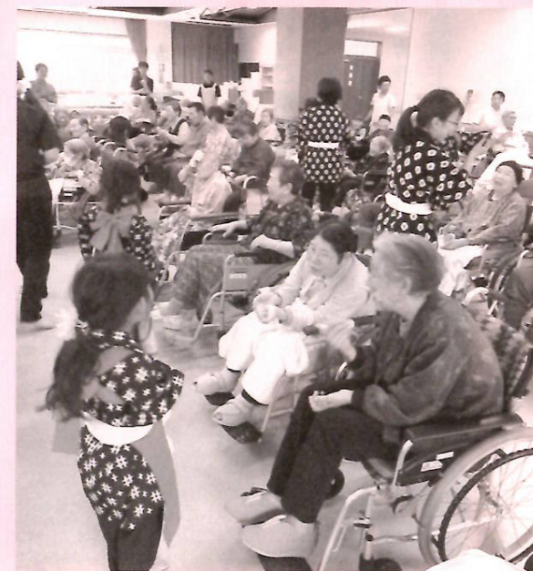
いっぱいふれあっていっぱい笑顔

「さなぶり」は農村地域の古くからの慣習で、農機のなかった時代には本当にお祭り騒ぎだっただろうと想像します。ぶなの園では6月14日(火)に「さなぶり祭り」を開催し、川舟保育所の子どもたちに楽しいステージを披露していただきました。衣装もパツパツ決まった伝統の「田植え踊り」から始まり、歌やお遊戯などまさにお祭りのような賑わい。全園児で6名という人数ですが、最後には住